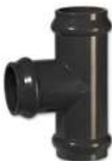
3004 "T" CON TRE ATTACCHI AD ANELLO IN GOMMA PN 10 / "TEE" WITH THREE O-RING TYPE CONNECTIONS PN10 / TÉ ÉGAL FFF 90° PN10