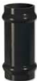
5000 BIGIUNTO SCORREVOLE CON O-RING PN 10 / SLIDING DOUBLE JOINT WITH O-RING PN 10 / MANCHON COULISSANT PN10