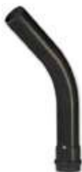
3002 CURVA LARGO RAGGIO A 45° CON O-RING PN 10 / 45° WIDE RADIUS BEND WITH O-RING PN 10 / COURBE MF GRAND RAYON 45° PN10