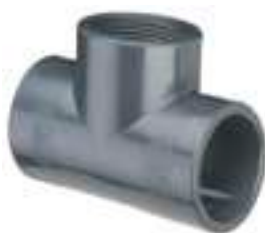
5042 " T " A 90° DERIV. FILETTATA PN 16 / TEE FEMALE WITH THREADED BRANCH - PN16 / TÉ À 90° F. À COLLER SUR Ø TARAUDÉ PN16