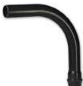
3003 CURVA LARGO RAGGIO A 90° CON O-RING PN 10 / 90° WIDE RADIUS BEND WITH O-RING PN 10 / COURBE MF GRAND RAYON 90° PN10