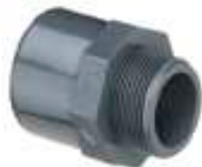
5212 MANICOTTO NIPPLO INCOLLAGGIO PN 16 FILETTATO / PVC SOLVENT WELDING NIPPLE SLEEVE THREADED - PN16 / MAMELON D'ADAPTATION M-F FILETÉ PN16

I RACCORDI SONO IN PN 16 COME DICHIARATO DAL COSTRUTTORE, E CERTIFICATI DA ENTE TERZO ACCREDITATO THE FITTINGS ARE PN16 AS DECLARED BY THE MANUFACTURER, AND CERTIFIED BY AN ACCREDITED THIRD INSTITUTION LES RACCORDS SONT EN PN16 COMME DÉCLARÉ PAR LE FABRICANT ET LE CERTIFICAT EST DÉLIVRÉ PAR UN ORGANISME TIERS AGRÉÉ.