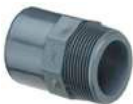
5062 NIPPLO/ NIPPLE/ MAMELON D'ADAPTATION M. À COLLER SUR Ø RÉDUIT F. FILETÉ