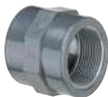
5012 MANICOTTO DI PASSAGGIO FILETTATO PN 16 / COUPLER REDUCTION THREADED PN16 / MANCHON D'ADAPTATION F. À COLLER SUR Ø TARAUDÉ PN16